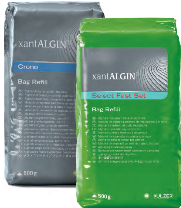
Cambio de color según la fase de fraguado de Xantalgin® Crono